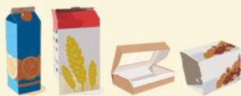
Briques alimentaires et cartonnettes Foodpackaging and cases