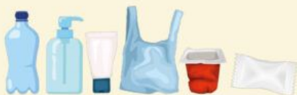
Emballages plastiques / Plastic packaging