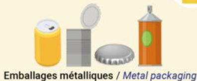
Emballages métalliques / Metal packaging